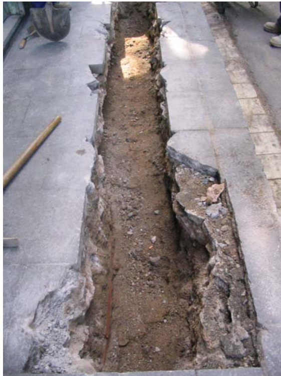
Fotografia núm. 1: Vista de la rasa 100