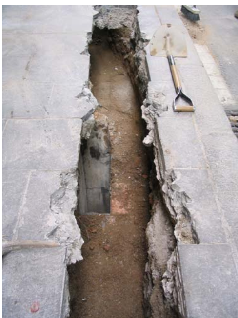
Fotografia núm. 3: vista de la Rasa 100