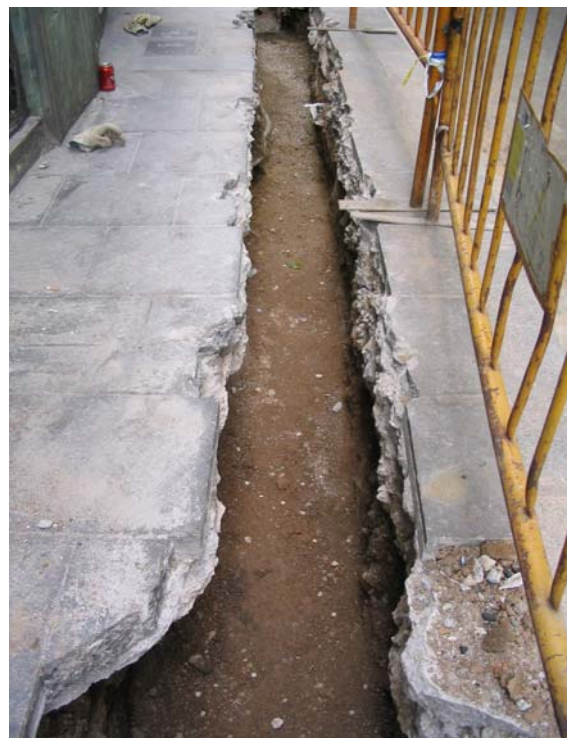
Fotografia núm. 2: vista de la rasa 100